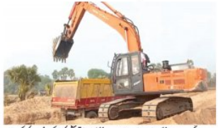
ریت کی غیر قانونی کانکنی کے حوالے سے 11 مئی کو تمام ڈپٹی کمشنر کے ساتھ نشست منعقد کی گئی۔