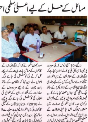
ای سی سی کے کارکنوں کے مسائل حل کے لیے اعلیٰ سطحی اجلاس منعقد کیا گیا۔